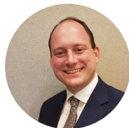
Olaf Account Manager

Een vakbekwame gastheer en sommelier. Met passie voor gastronomie.