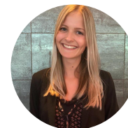
Valerie Account Manager

Gastheer, ervaren hotelman en zet zich volledig in voor zijn gasten.