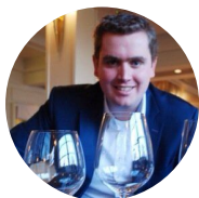
Jasper Restaurant Manager

Leiding over de keuken. Groot gevoel voor kwaliteit.